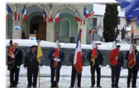
Modane le 17 décembre 2017