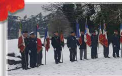
Villeurbanne, nécropole militaire de la Doubs le 18 décembre 2017

En décembre dernier nous commémorons le centenaire de la catastrophe ferroviaire de St Michel de Maurienne du 02 au 18 décembre 2017.