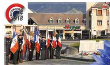
St Jean de Maurienne le 3 décembre 2017