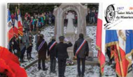
St Michel de Maurienne le 12 décembre 2017