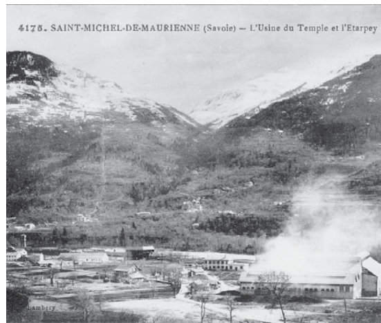
4175. SAINT-MICHEL-DE-MAURIENNE (Savoie) - L'Usine du Temple et l'Étarpey

Alors que la guerre de 14-18 provoque un essor de la houille blanche en France, Louis Renault a l'idée de la construction des ateliers de fabrication de carbure de calcium et de ferro-silicium au lieu-dit le Temple, près de l'agglomération de St Michel-de-Maurienne et de sa gare. Il commence les travaux en 1917 et en 1929 les Acières du Temple, jusque là modestes sont enfin capables d'alimenter ses usines de Billancourt, notamment grâce au vaste projet de Bissorte. En effet le barrage lui fournit assez d'énergie pour devenir l'une des usines les plus importantes de l'époque. Les Acières du Temple seront nationalisées le 15 octobre 1945 et son président-directeur général est alors Pierre Lefauchoux.