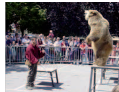
Spectacle de l'Ours 2003

En 2003, l'Ours a fait un spectacle devant une foule de visiteurs dans le gymnase... mais au moment de sortir... cela s'est compliqué... l'animal ne voulait plus passer par l'issue prévue en raison des escaliers... il a fallu sécuriser les visiteurs pour sortir, ce qui n'a pas été sans mal.