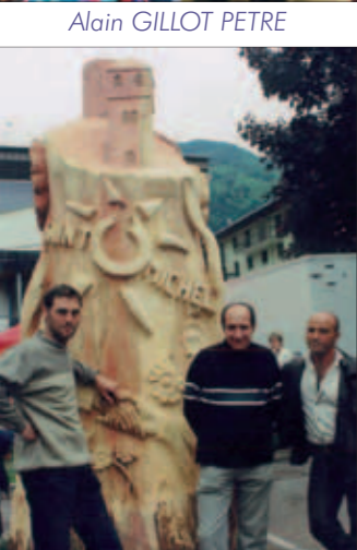
Sculpture du 10e anniversaire