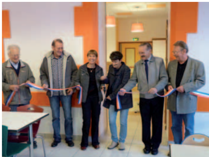
Inauguration du restaurant scolaire.

Fin 2011, 110 enfants sont inscrits pour un accueil régulier ou occasionnel. Depuis janvier, avec le démarrage de la saison d'hiver pour certains parents, les besoins ont augmenté : 40 à 50 repas sont servis quotidiennement et plus de 20 enfants fréquentent l'accueil périscolaire le soir.