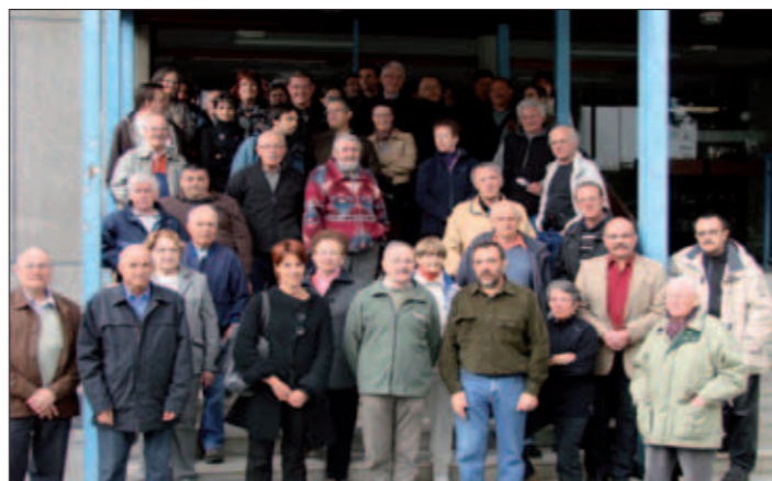
Equipe des bénévoles 2010

Si vous souhaitez rejoindre l'équipe, rendez-vous en mairie ou sur notre site internet www.saint-michel-de-maurienne.com pour compléter la fiche bénévole dans la rubrique Événements.