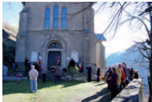
Le 11 novembre au Thyl.