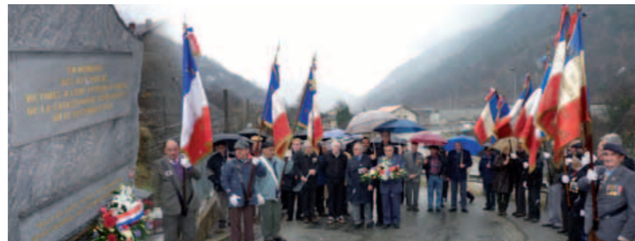
Le 12 décembre à Saint-Michel-de-Maurienne.

Le Souvenir Français, les anciens combattants et les élus se réunissaient le 12 décembre 2011 afin d'honorer la mémoire des 427 poilus qui trouvèrent la mort dans la catastrophe ferroviaire de 1917 à l'entrée de la ville.