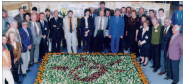
Officiels et fleurissement du lycée du Bocage - 1999

Il est composé d'élus, de bénévoles et du GEPRO: toute bonne volonté prête à apporter ses idées est la bienvenue. Il se réunit chaque mois, pour préparer le week-end de la Foire: recherche d'expositions, d'animations, de musiques, de nouveaux exposants, organisation du concours de sculptures, respect des réglementations...